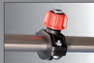
ugello aspersione acqua water sprinkler nozzle

Via Grande, 15 - 42028 Poviglio (RE) - Italy tel. +39 0522 969610 - fax +39 0522 960583 www.itecosrl.com - e-mail: info@itecosrl.com