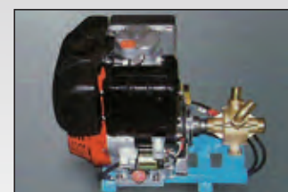
gruppo motore diesel diesel engine unit