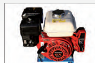
gruppo motore Honda Honda motor unit