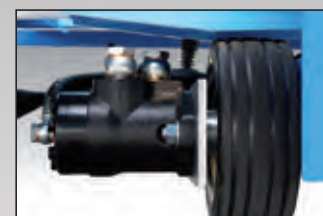
ruota trazione traction wheel