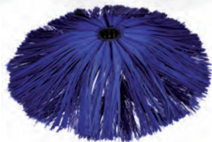
spazzola mista polietilene carlite mixed brush

The brush, made of high density soft material allows a thorough cleaning of large surfaces in a short space of time. Also available with carlite or mixed brush (optional).