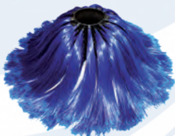
spazzola in polietilene alta densità high density polyethylene brush

EASYWASH 300 is equipped with a tilting facility, therefore the brush always perfectly fits the surface to be cleaned.