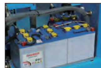
gruppo batteria 24V 24V battery pack