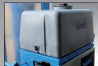
serbatoio acqua water tank