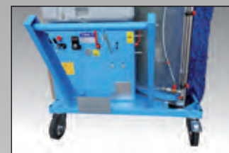
maniglione con comandi controls handle